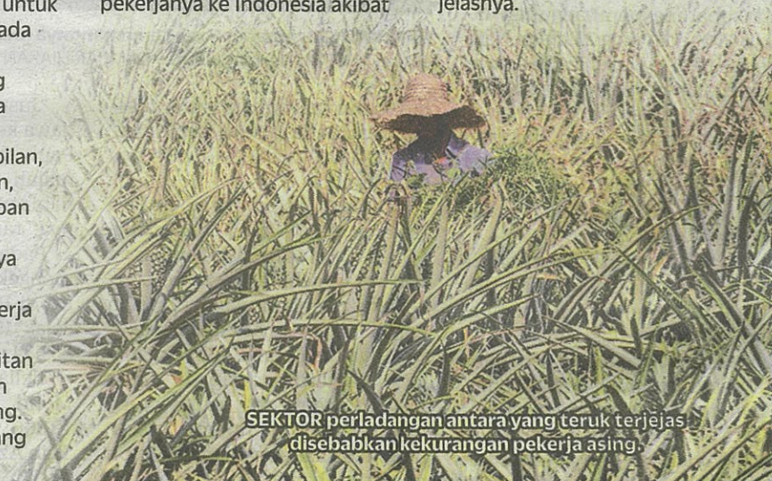
SEKTOR perladangan antara yang teruk terjejas disebabkan kekurangan pekerja asing.

"Saya harap sekarang ini, perniagaan dan ekonomi kembali pulih seperti sedia kala. Meskipun sudah masuk ke fasa endemik, masalah tenaga kerja masih ada dan bilangan pelanggan juga masih kurang," jelasnya.