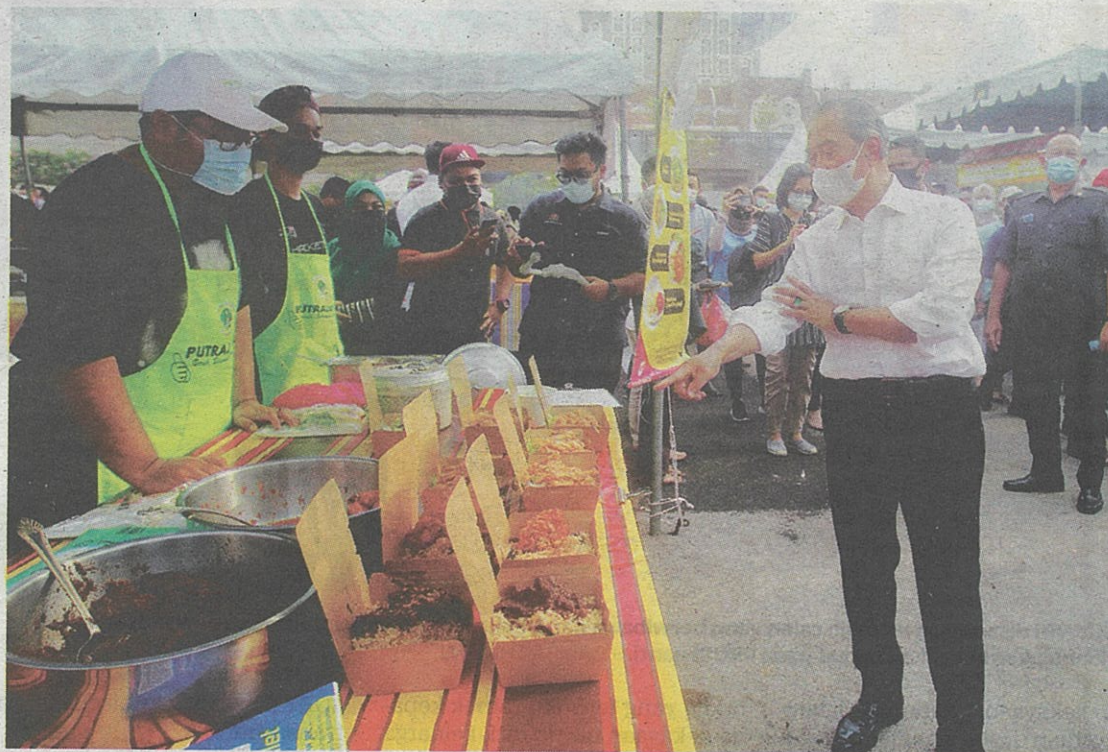
MPN di bawah teraju Tan Sri Muhyiddin Yassin prihatin akan masalah yang dihadapi PMKS masa kini, termasuk dari segi kekurangan tenaga buruh di pasaran.

"Saya amat mengharapkan agar kerajaan mempertimbangkan cadangan